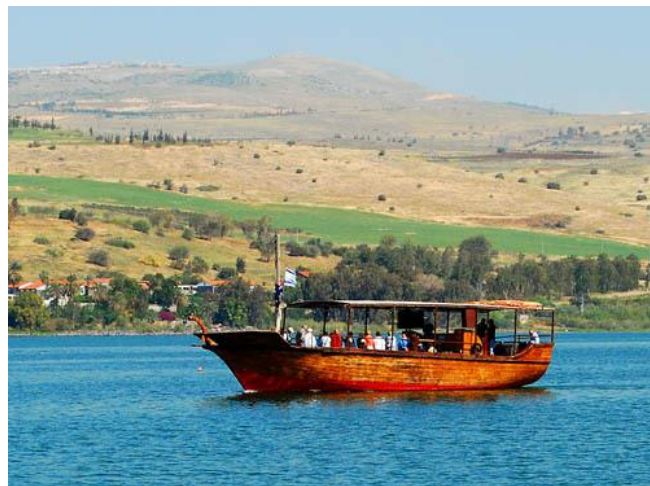
Båttur på Genesaretsjøen