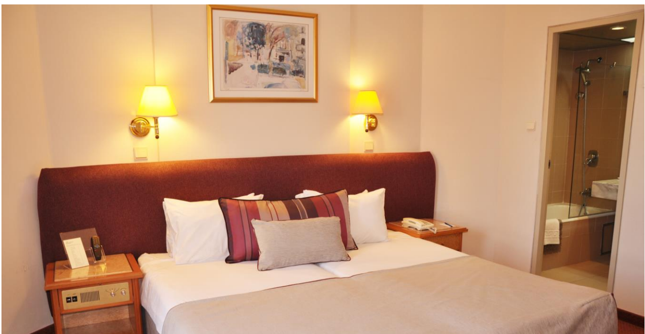
Royal Wing hotel, Jerusalem