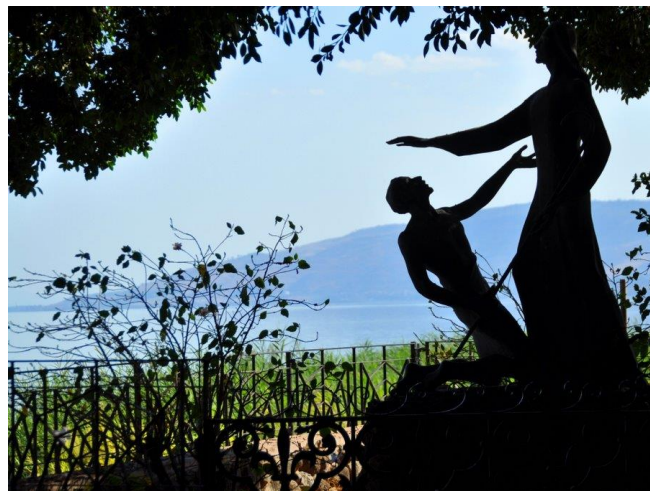
«Elsker du meg» - stedet