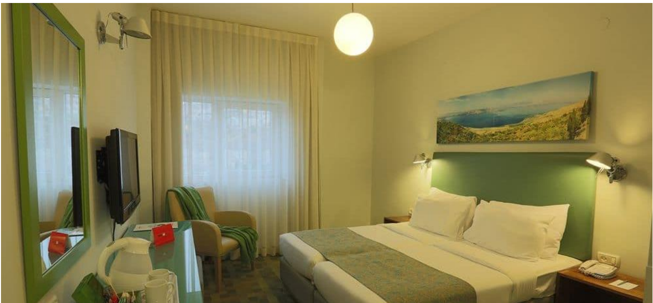
Prima Too hotel, Tiberias

Prisene er gitt på gjeldende flypriser og valutakurser. Det tas forbehold om programendringer og at det melder seg nok deltakere til å gjennomføre turen.